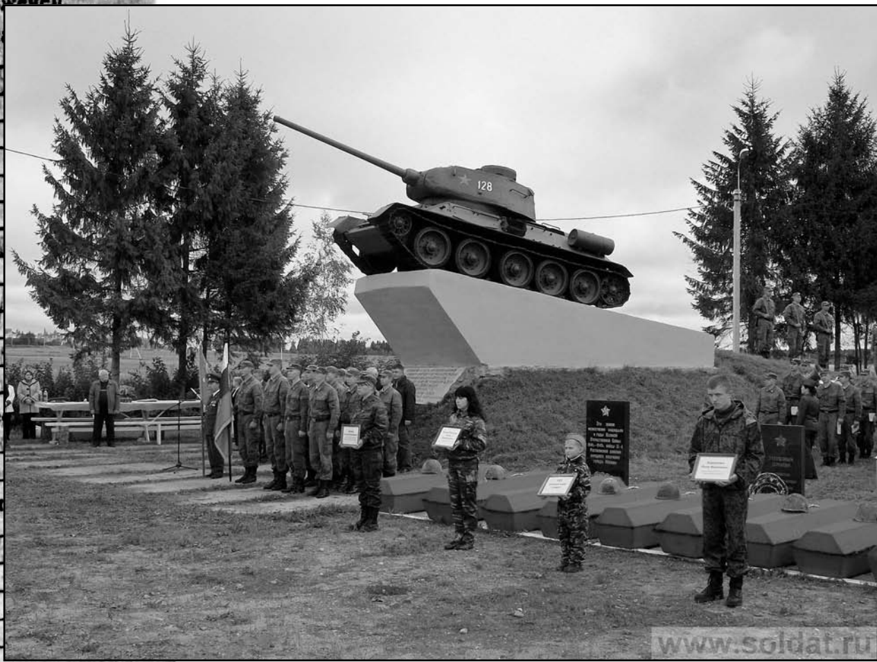
Смоленская область, Холм-Жирковский район. 2011 год.

Республика _____ Край _____ Область _____ Город _____ Район _____ С/совет _____ Деревня _____ Адрес _____ Фамилия _____ Республика _____ Край _____ Область _____ Город _____