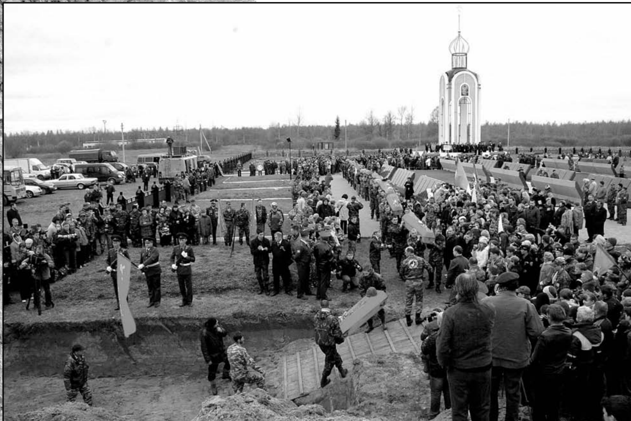
Фото А.Кочевника, Новгородская область.