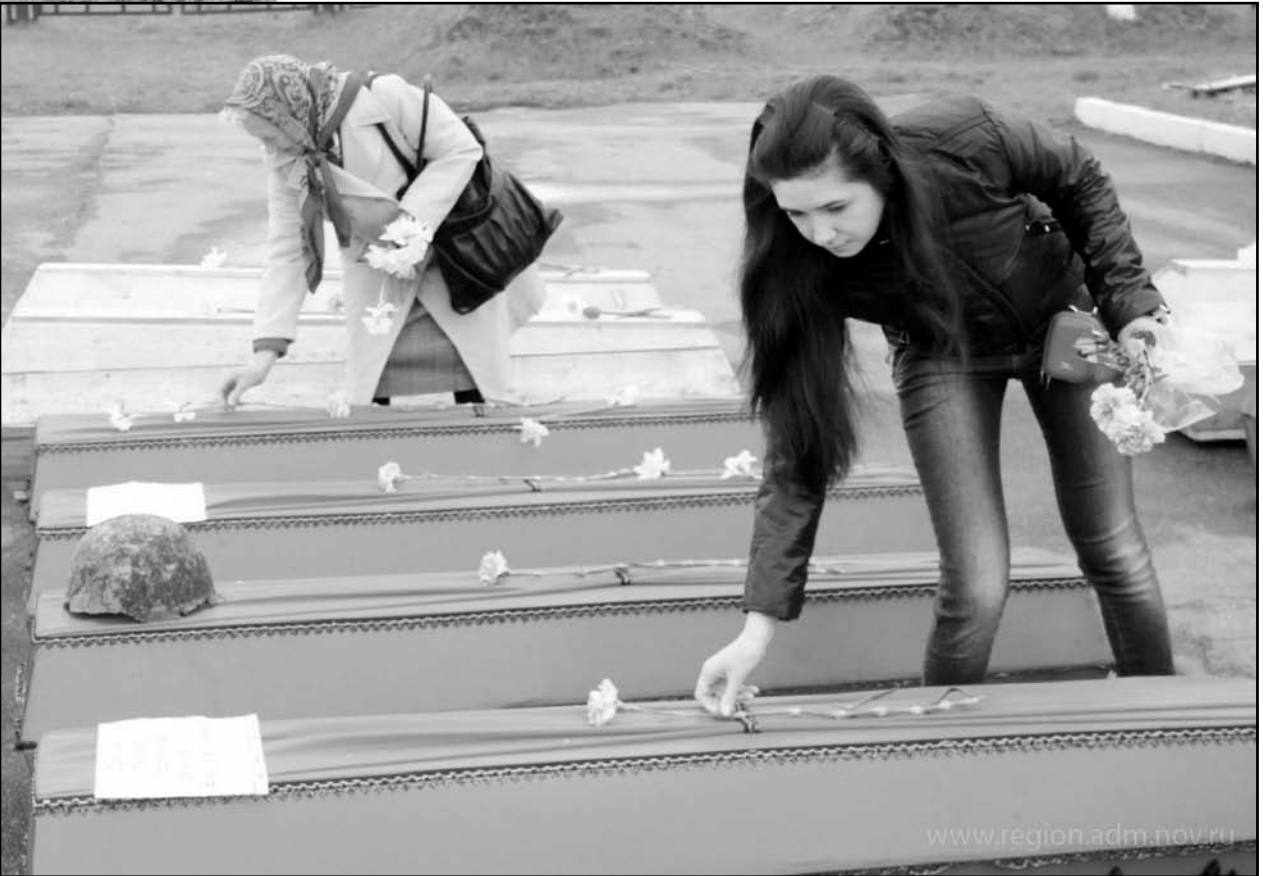
«Прохожий, вспомни обо мне и всех безвестных и пропавших». Воинский мемориал в д.Мясной Бор Новгородской области.