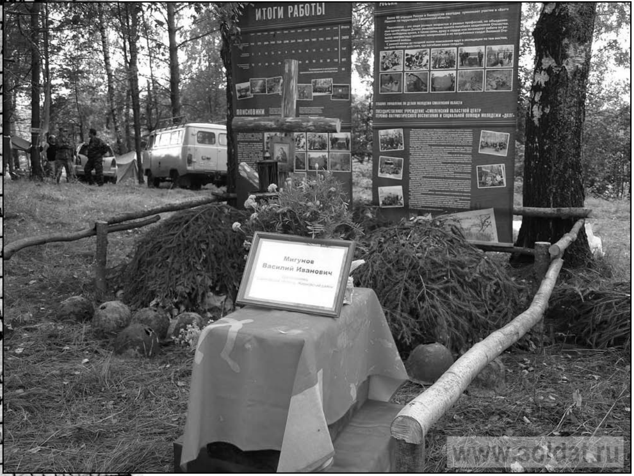
В лагере поисковиков у д.Бортники Ярцевского района Смоленской области. 14 августа 2011 года.

Город Киров Район Кировский С/совет Водобейки Деревня Давыдовское Каким РВК мобилизован Кировский № 11 Группа крови " " по Янскому